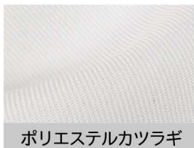
ポリエステルカツラギ