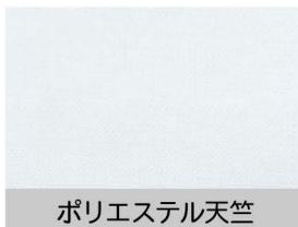
ポリエステル天竺