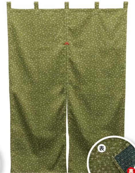
若草色 商品No. 43018