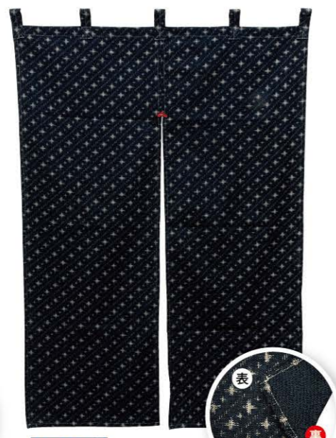
斜並十字 商品No. 43014