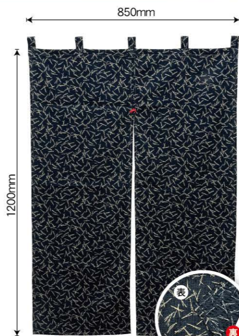
松葉 商品No. 43012