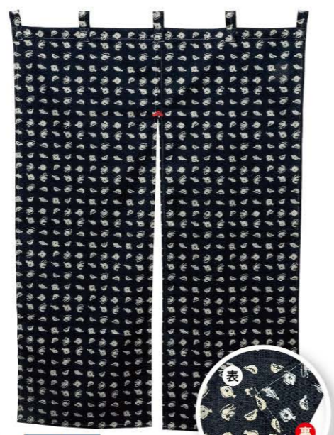
さかな 商品No. 43015