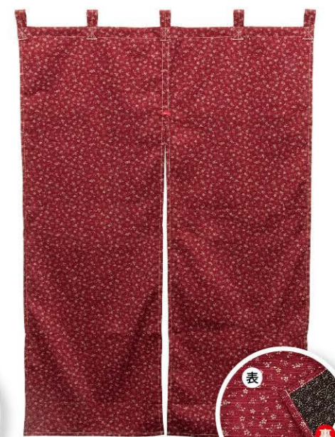
紅・黒色 商品No. 43021