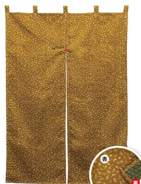
南瓜色 商品No. 43019