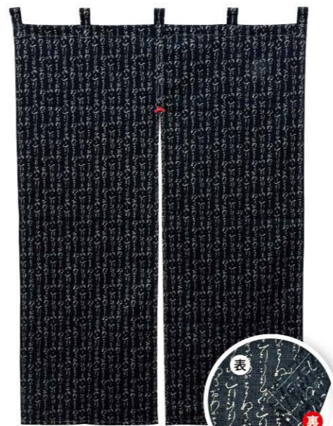
いろは 商品No. 43016