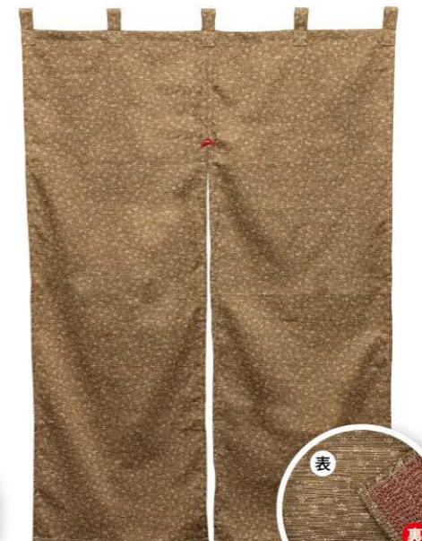
亜麻色 商品No. 43017