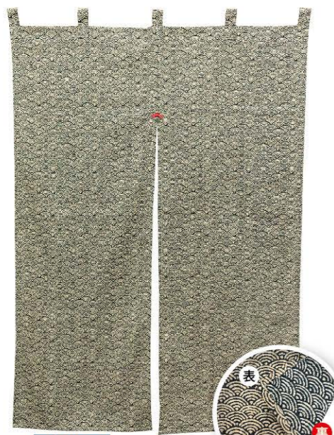
青海波 商品No. 43013