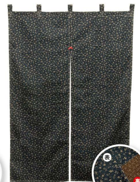
紺・茶色 商品No. 43020