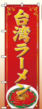
商品No.SNB-4779 G1枚 ¥2,800 ★2受注生産 (+消費税)