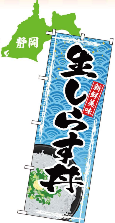
NEW 商品No.SNB-4788 G1枚 ¥2,800 ★2受注生産 (+消費税)