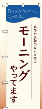
商品No.SNB-4784 G1枚 ¥2,800 ★2受注生産 (+消費税)