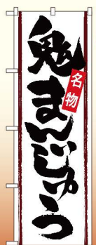
商品No.SNB-4783 G1枚 ¥2,800 ★2受注生産 (+消費税)