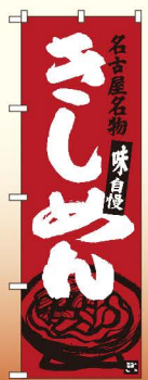
商品No.SNB-3527 G1枚 ¥2,800 通常在庫品 (+消費税)