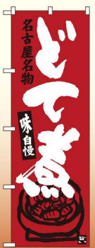
商品No.SNB-3545 G1枚 ¥2,800 ★2受注生産 (+消費税)