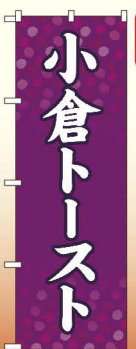
商品No.SNB-4785 G1枚 ¥2,800 ★2受注生産 (+消費税)