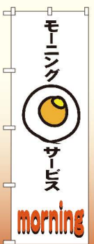
商品No.SNB-3563 G1枚 ¥2,800 ★2受注生産 (+消費税)