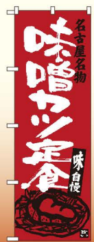
商品No.SNB-3541 G1枚 ¥2,800 ★2受注生産 (+消費税)