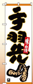
商品No.26317 G1枚 ¥2,400 通常在庫品 (+消費税)