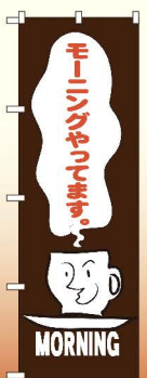
商品No.SNB-3561 G1枚 ¥2,800 ★2受注生産 (+消費税)