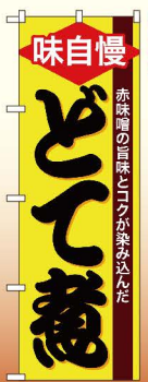
商品No.SNB-4782 G1枚 ¥2,800 ★2受注生産 (+消費税)