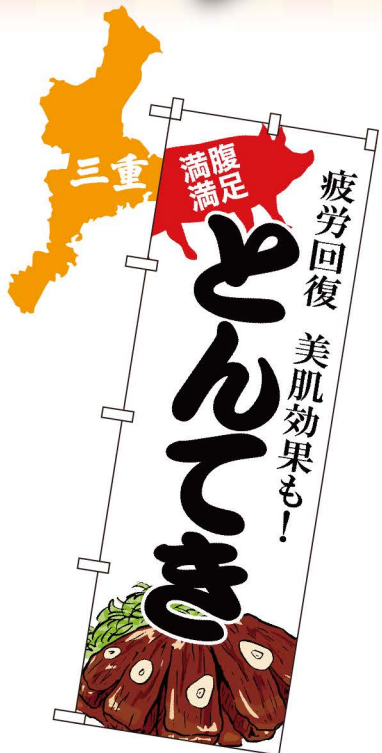
NEW 商品No.SNB-4786 G1枚 ¥2,800 ★2受注生産 (+消費税)