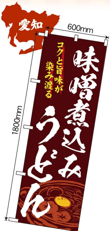
NEW 商品No.SNB-4778 G1枚 ¥2,800 ★2受注生産 (+消費税)