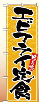
商品No.SNB-4781 G1枚 ¥2,800 ★2受注生産 (+消費税)