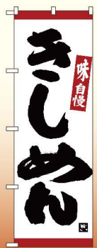
商品No.26329 G1枚 ¥2,800 通常在庫品 (+消費税)