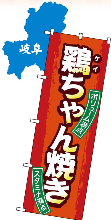
NEW 商品No.SNB-4792 G1枚 ¥2,800 ★2受注生産 (+消費税)