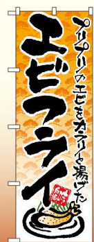
商品No.21056 G1枚 ¥2,800 ★2受注生産 (+消費税)