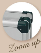
アルミ製親子式強化トランク（鍵付き） 親：45×10×100cm 子：23×17×100cm