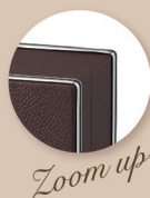
レザー張親子式トランク（鍵付き） 親：46×10×100cm 子：18×14×91cm