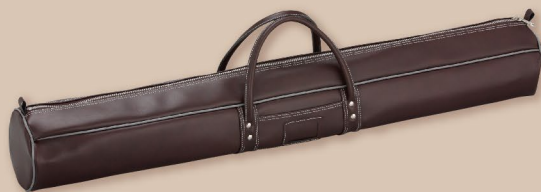
ビニールレザー手提げバッグ小 Φ12×90cm