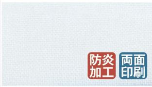
ポリエステル天竺