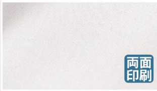
ポリエステルハンブ