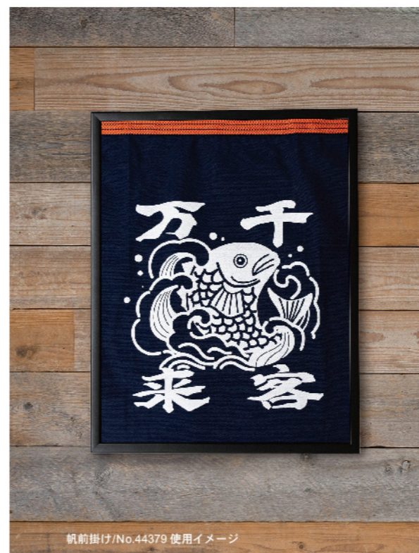
帆前掛け/No.44379 使用イメージ

“帆前掛け”や“ユニフォーム”を店内ディスプレイとして飾るための専用フレームもご用意しております。