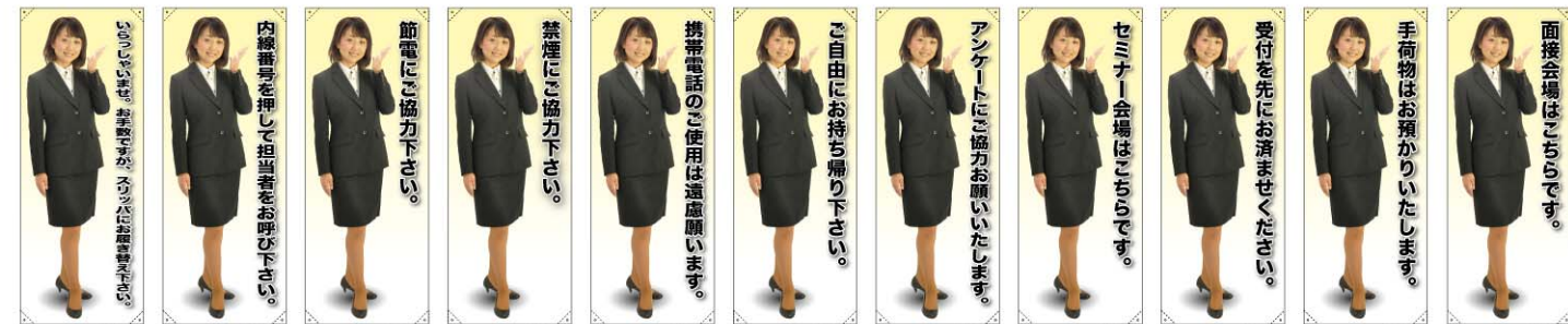
トロマット 商品No. 61591 ボンジ 商品No. 61691