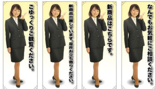
トロマット 商品No. 61590 ボンジ 商品No. 61690