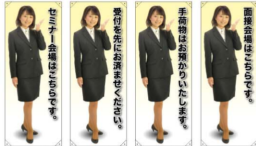
トロマット 商品No. 61589 ボンジ 商品No. 61689