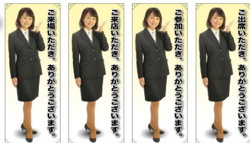
トロマット 商品No. 61587 ボンジ 商品No. 61687