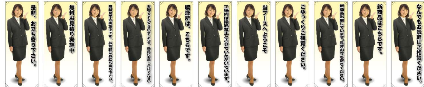
トロマット 商品No. 61592 ボンジ 商品No. 61692