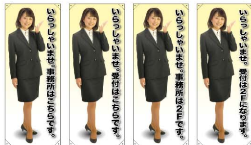
トロマット 商品No. 61588 ボンジ 商品No. 61688